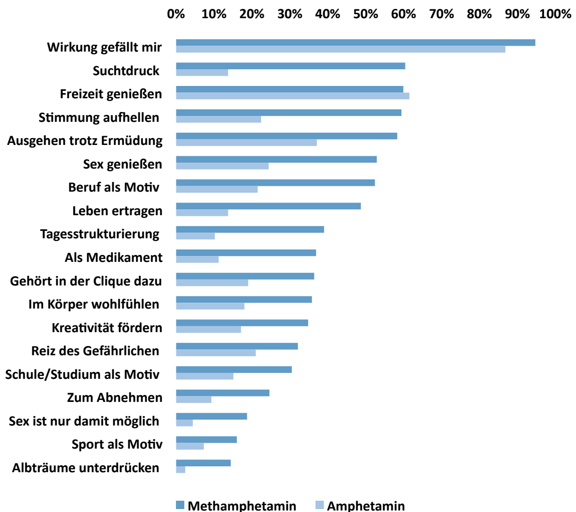
Abbildung 3: Konsummotive

Als Hauptmotiv für den Konsum gab ein Großteil der Amphetamin- und Methamphetamin-Konsumenten die angenehme Wirkung der Substanz an (s. Abb. 3). In der Gruppe der Methamphetamin-Konsumenten wird deutlich, dass ein größerer Anteil der Teilnehmer insgesamt eine hohe Anzahl an Motiven für den Konsum berichtete. Neben der angenehmen Wirkung der Substanz (94,7%) waren das Genießen der Freizeit (59,9%), Ausgehen trotz Ermüdung (58,3%) und das Genießen von Sex (52,9%) wichtige Konsummotive. Methamphetamin wurde auch häufig konsumiert, um die Stimmung aufzuhellen (59,4%), das Leben zu ertragen (48,7%) sowie aus beruflichen Gründen (52,4%). Die Mehrheit der Methamphetamin-Konsumenten (60,4%) gab zudem an, aufgrund von Suchtdruck zu konsumieren.